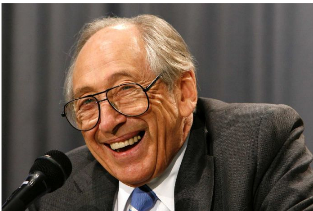
อัลวิน ทอฟฟเลอร์ (Alvin Toffler)

“ คุณต้องคิดถึงภาพใหญ่ แม้ขณะที่ทำเรื่องเล็กๆ แล้วเรื่องเล็กๆ เหล่านั้น จะนำไปสู่ทิศทางที่ถูกต้อง ”